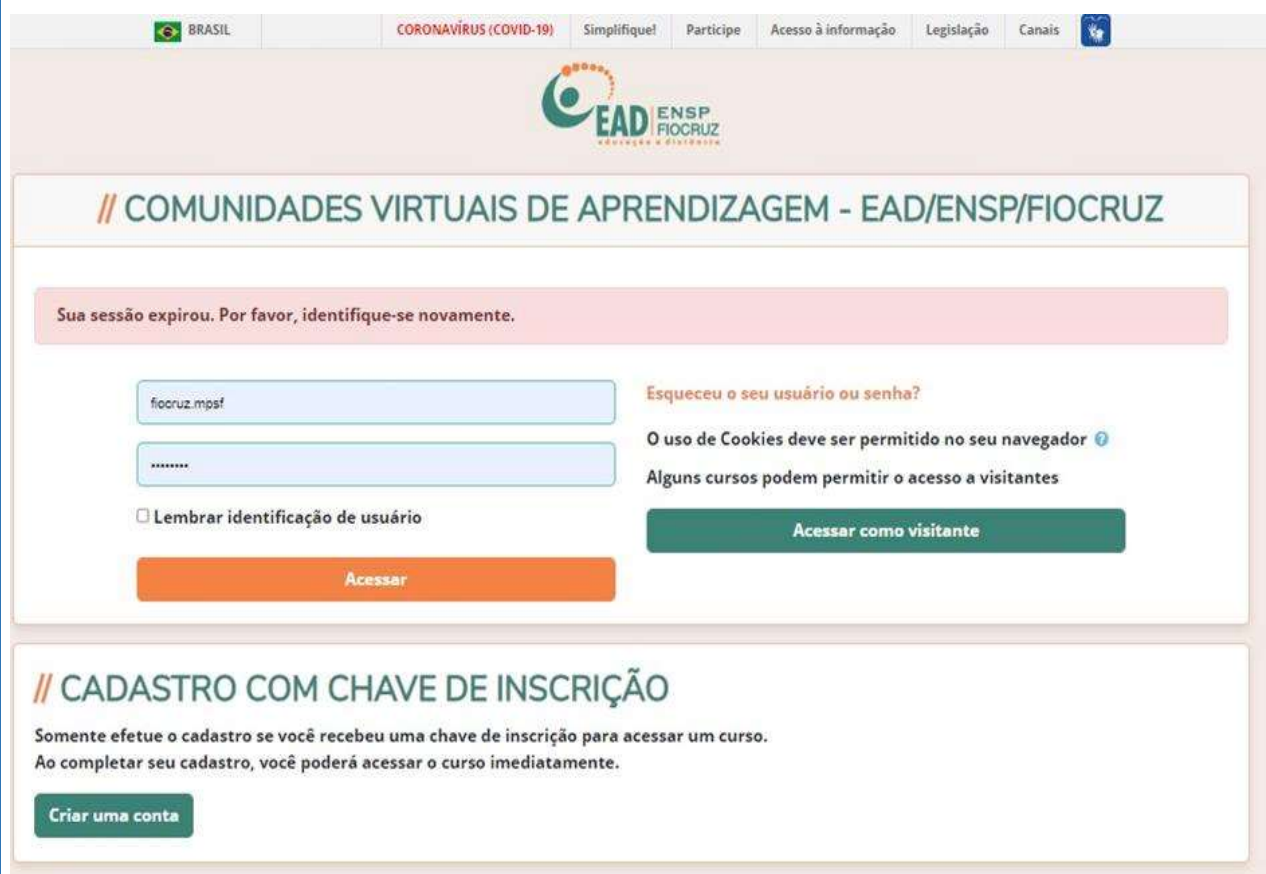
Figura 1 – Ambiente Virtual de Aprendizagem utilizado às disciplinas do DPSF.

A turma 2 do DPSF será desenvolvida no formato presencial, com aulas a cada 15 dias e 20% das atividades serão realizadas de forma remota através de atividades de dispersão. O PPGSF possui um Ambiente Virtual de Aprendizagem (AVA), o qual é utilizado como repositório, além de servir para estratégias educacionais virtuais das disciplinas (Figura 1).